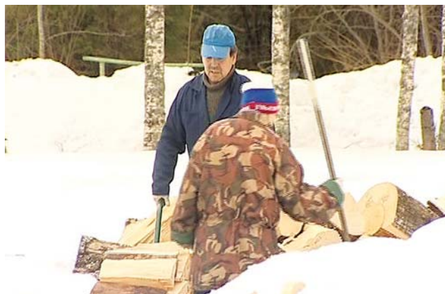
Для пациентов созданы все условия труда и быта