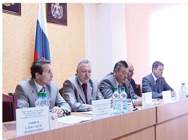
Опыт центра в Торбино нуждается в распространении – рекомендовала Антинаркотическая комиссия в Новгородской области