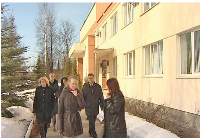
Учленов рабочей группы Антинаркотической комиссии, побывавшей в Окуловском районе весной этого года, сложилось самое благоприятное мнение о постановке работы местного реабилитационного центра

Для действенной помощи пациентам специалисты строят большие планы – открыть круглосуточный «телефон доверия» для наркологических больных и их родственников – лишь малая толика перспективной работы. Большое внимание в ближайшие годы собираются уделить ремонтным работам в специализированных медицинских учреждениях – один из первых на очереди – наркодиспансер «Катарсис», детско-подростковое отделение которого скоро переведут на новые, более просторные площади. Затем – займутся психоневрологическими диспансерами в Боровичах, Чудово и Старой Руссе. Среди приоритетов – ремонты в наркологических кабинетах в районах. По окончании их обустройства и реконструкции комитет по охране здоровья населения области готов немедленно поставить туда профильное оборудование. В планах комиссии – открытие на базе «Катарсиса» общежития для наркологических больных, прошедших курс лечения, так называемый «дом на полпути». Впрочем, наряду с государственной медициной, бороться с наркоманией и алкоголизмом должно все общество. К сожалению, общественных организаций, занимающихся подобным родом деятельности – пока единицы, активнее, по мнению представителей антинаркотической комиссии, могла бы участвовать в процессе и новгородская православная епархия. К слову, в области уже существует 2 религиозных центра помощи наркозависимым – один в Боровичском, другой в Солецком районе, но и тут есть некоторые сложности – их деятельность не лицензируется и наблюдение врачей за пациентами – не ведется.